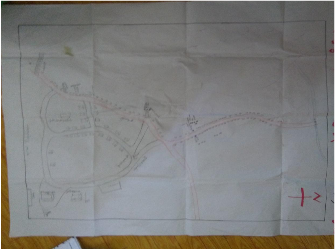
အရင်းမြစ်ပြမြေပုံ

ကျန်းမာရေးအနေဖြင့် နာမကျန်းဖြစ်ပါက ကျေးလက်ဆေးပေးခန်း မရှိသောကြောင့် ကြိုတင်ဆေးဝယ်ထားရခြင်း၊ ရွာရှိ ဈေးဆိုင်များမှ ဆေးဝယ်သောက်ရခြင်း ပြုလုပ်ပြီး မသက်သာပါက ဘုတ်ပြင်းမြို့နှင့် ကော့သောင်းဆေးရုံများသို့ ခက်ခက် ခဲခဲ သွားရောက်ကုသကြပါသည်။ သောက်သုံးရေအနေဖြင့် ရွာရေတွင်းနှင့် အဝီစိတွင်းများမှ ရရှိပါသည်။ လူဦးရေထူထပ်လာပြီး ရေသယံဇာတလျော့နည်းလာပါသည်။ ကျားကိုက်အော်ကျေးရွာတွင် ဥယျာဉ်ခြံနည်းငယ်ရှိပြီး သစ်တောအနည်းငယ် ရှိပါသည်။